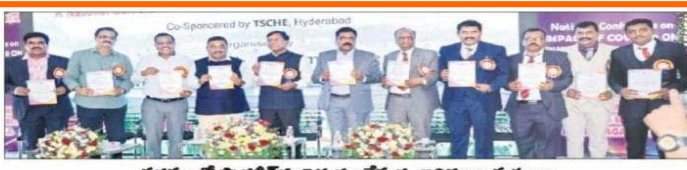
సదస్సులో సావనీర్ ను విడుదలచేస్తున్న అతిథులు, సభ్యులు