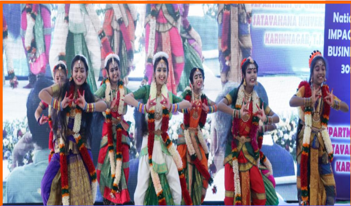
Welcome Dance at inaugural function