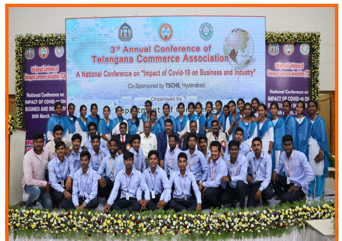
Group photo with MCOM students