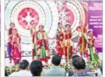
స్వత్యం చేస్తున్న విద్యార్థులను