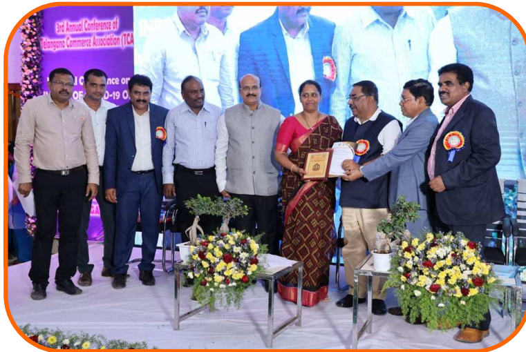
Best paper Awardee